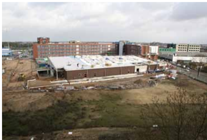
Het complex moet voor de bouwvak klaar zijn.

Een ander uitgangspunt voor het gebouw is flexibiliteit. Van Oorschot: "We wilden heel gemakkelijk de binnenschil kunnen veranderen." In het gebouw is een goede balans gevonden tussen kwaliteit en eenvoud. Het is een mooi ingetogen gebouw met hoogwaardige duurzame materialen. Het is kwaliteit zonder franje. Dit past heel goed bij de bedrijfsformule van Lidl. Wat dit gebouw bijzonder maakt, is de combinatie van twee verschillende functies: supermarkt en hoofdkantoor. De winkel is onderdeel van het hoofdkantoor, maar staat er ook los van."