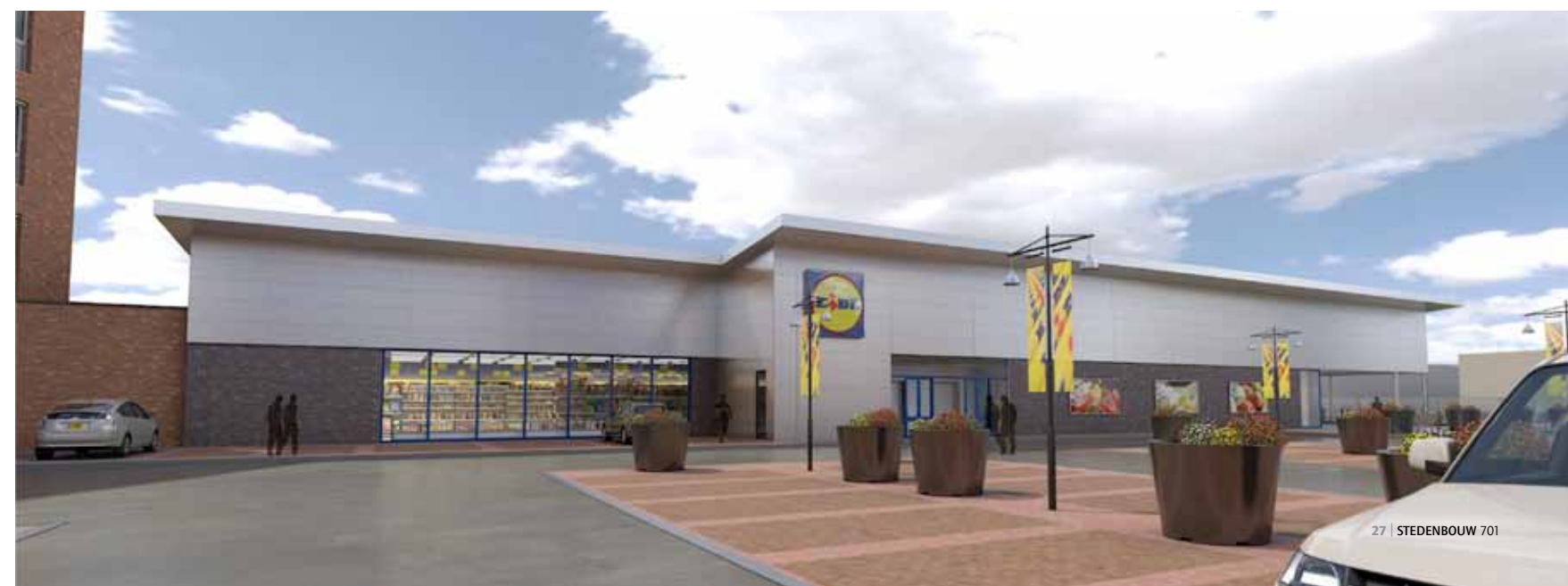
De winkel is onderdeel van het hoofdkantoor, maar staat er ook los van.

Het gebouw wordt gekoeld en verwarmd met een WKO-installatie. De opslag van warmte en koude komt op 75 meter diepte. Er komt warmterugwinning in de supermarkt. "Het meest bijzondere is dat zowel de winkel, het kantoor als de parkeergarage ledverlichting krijgt", aldus Van Oorschoot. "Het hele gebouw maakt dus gebruik van energiezuinige verlichting. Volgens onze leverancier Philips is het de eerste volledige toepassing van 'led' in de utiliteitsbouw. Dat is dus een primeur. Andere duurzame toepassingen zijn het doorspoelen van de toiletten met regenwater en bewegingssensoren op verlichting." ▶