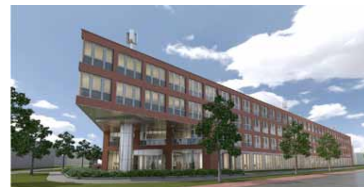
Eén centraal hoofdkantoor voor Lidl Nederland.